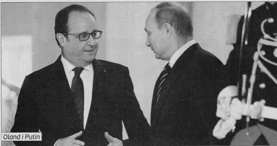
Oland i Putin